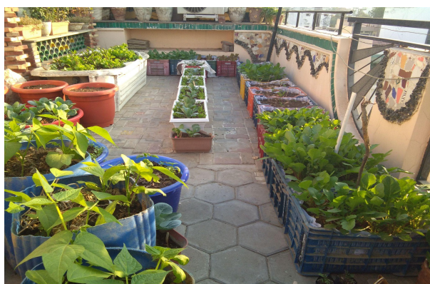
Diferentes técnicas de jardinagem para a agricultura urbana