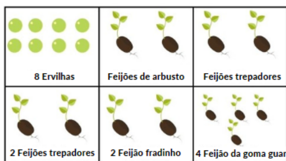
Plano de jardim de varanda no metro quadrado para cultivo de leguminosas

Para começar a desenvolver esse sentido, vamos usar uma técnica simples chamada “jardinagem do metro quadrado”. Cada caixa da planta representa uma área de um metro quadrado, que são quadrados de 30 cm de lado.